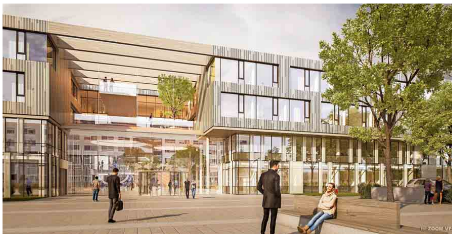
So soll Freiburgs derzeit teuerstes Bauvorhaben nach der Fertigstellung 2022 aussehen: die Kinder- und Jugendklinik.